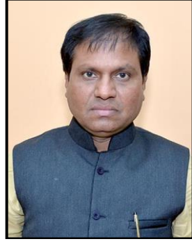
પ્રા. એસ. જી. મેમોરીયા